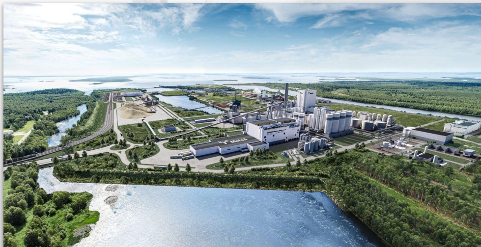
Metsä Fibre Oy, Kemin uusi tehdas

Rikkihappolaitoksen, putkisiltojen perustuksien, viipymäaltaan ja kahden jätevedenpumppaamon betoni- ja maanrakennustyöt.