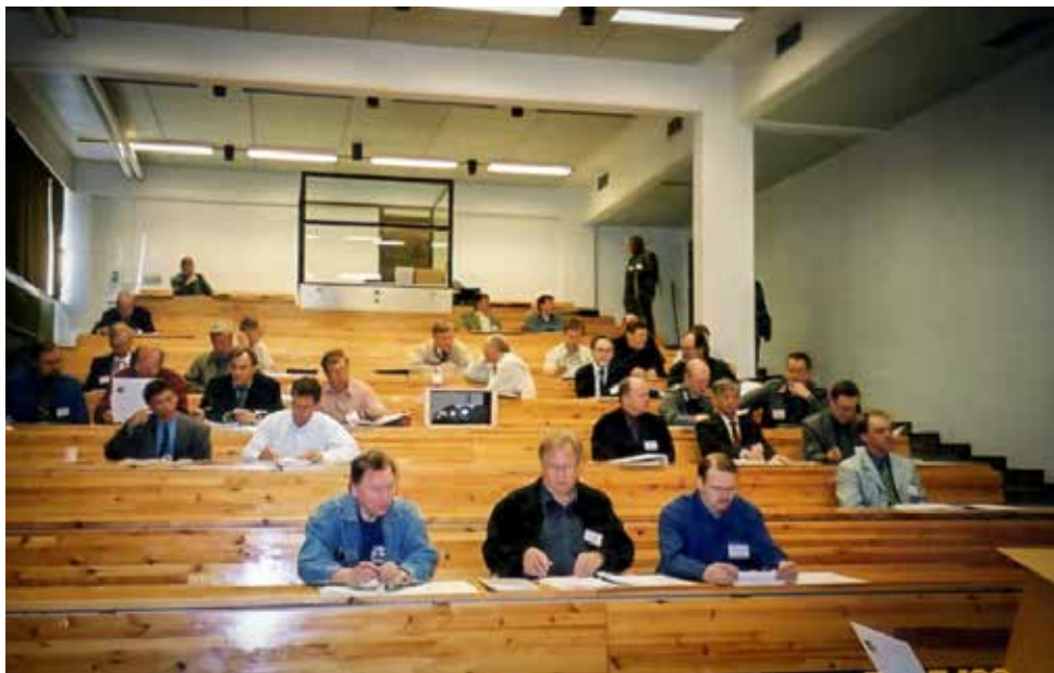
Myös itäsuomalaiset rakentajat ovat mukana varautumassa kriisiaikoihin Rakennuspoolin kautta. Kuva valmiusharjoituksesta Kontiorannan varuskunnassa.