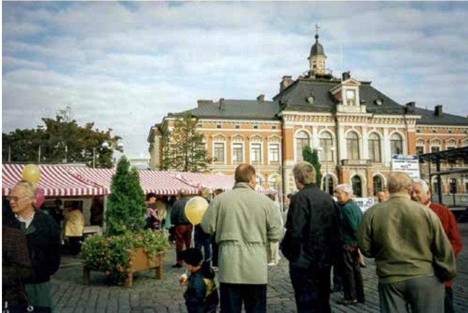
“Osta uusi asunto suoraan rakentajalta!” -kampanja kiinnosti yleisöä Kuopion torilla syyskuussa 2001.