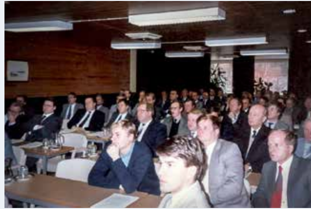
Ensimmäisen Rakentajan nykypäivä -seminaarin osallistujia Kuopiossa 1985.