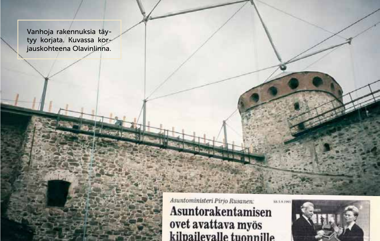
Vanhoja rakennuksia täytyy korjata. Kuvassa korjauskohteena Olavinlinna.