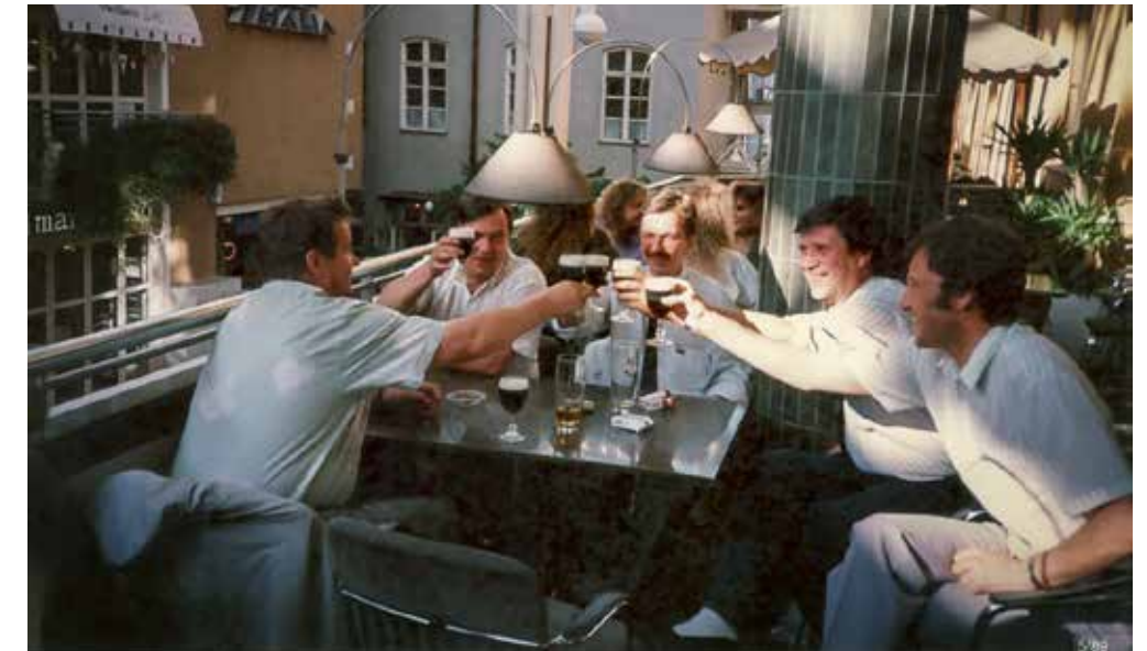
Ulkomaille suuntautuneiden koulutus matkojen ohjelma on sopiva sekoitus asiaa ja kevyempää yhdessäoloa.