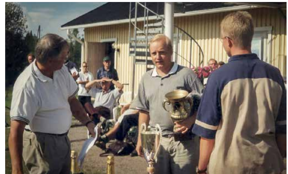
Rakentajat, rakennuttajat ja sidosryhmien edustajat mittelevät säännöllisesti paremmuudesta Rakentaja-golfturnauksessa.

– Olen sanonut, että olen kerrassaan lottovoittaja, kun kahdelle toimialalle löytyi omasta perheestä taitavat jatkajat.