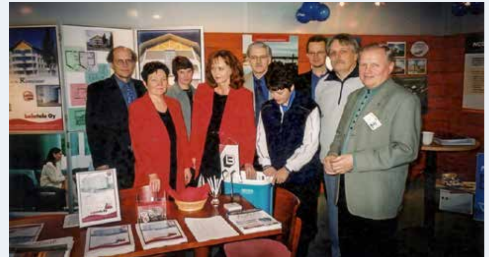
"Osta uusi asunto suoraan rakentajalta!" -kampanja markkinoi asuntoja Joensuussa lokakuussa 2001.