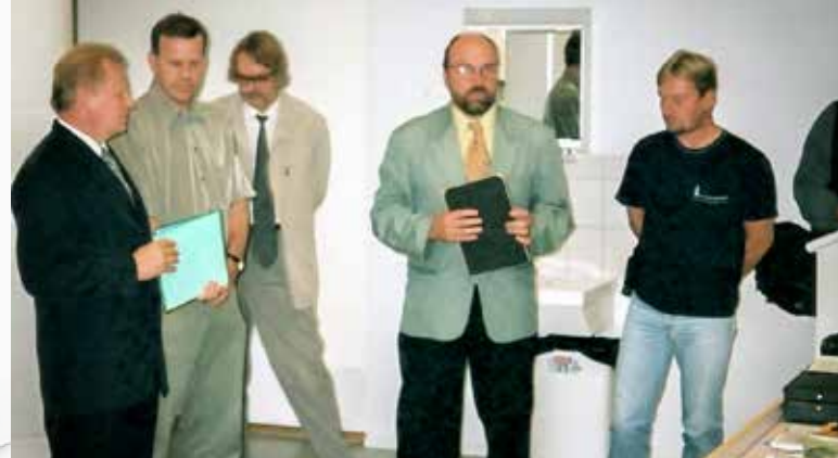
Työturvallisuuskilpailun käynnistäminen Joensuussa elokuussa 2000.

Rakentaminen on vilkasta erityisesti Joensuussa muun muassa siltatyömaiden ja useiden kerrostalohankkeiden ansiosta. Joensuun torin kulmalla puretaan entistä Oman-Avun kiinteistöä uudellen pankkitalon tieltä. Sivu 10