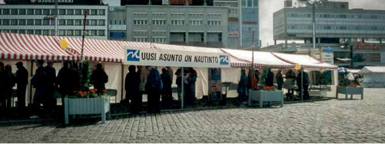
Uusien asuntojen markkinointia Kuopion torilla syyskuussa 2001.