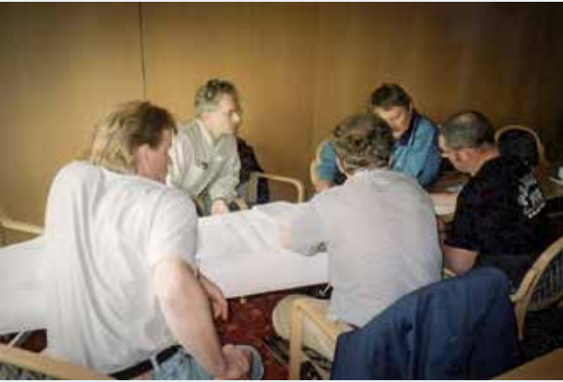
Koulutuksen ryhmätö pistää miettimään.