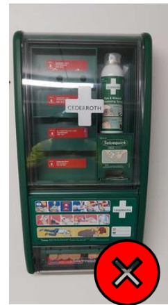
Ensiaputelineestä puuttuu ensiapupakkauksia