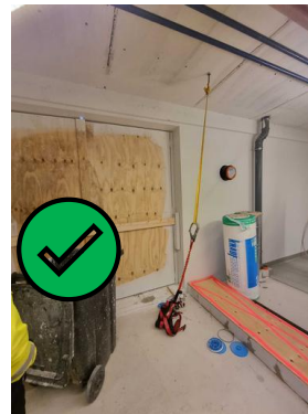
Valjaat valmiina haalausaukolla