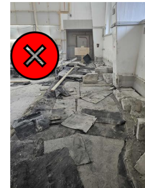
Hätäpoistumistiellä ylimääräistä jätettä