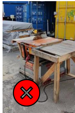
Sirkkelin teräsuoja ylhäällä