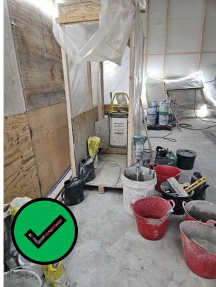
Sekoituskoppi on siistissä kunnossa