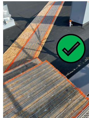
Kulkitiet merkattu hyvin ja talveen varauduttu