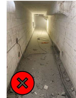
Pölyn torjunta/hallinta pettänyt