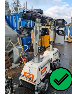
Valaisimia varattu työmaalle