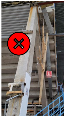
Lankkunippu roikkui sähköroikan varassa