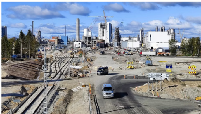
Onnettomuudessa kuollut mies oli ulkomaalainen ja syntynyt vuonna 1994.

Helmikuussa Metsä Fibren tehtaan rakennustyömaalla kuoli ulkomaalainen hitsaaja, joka meni isoon putkeen ja tukehtui siellä korkean argonkaasupitoisuuden vuoksi.