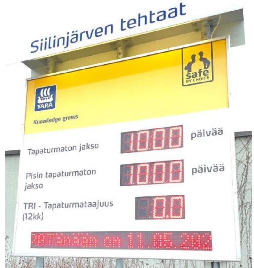
Tapaturmataajuus 2020-2022 kk-tilasto